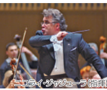
ニコライ・ジャジュラ (指揮)