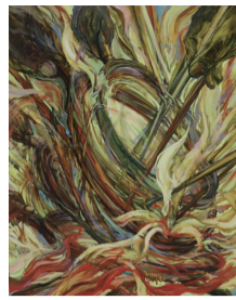
第31回大賞 QI ZHICHENG 油彩 [舞]