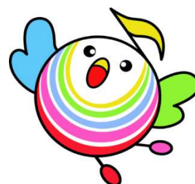
立川文化芸術のまちづくり協議会キャラクター 「メロリン」