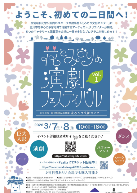
表紙画像：令和7年度文化芸術のまちづくり補助金対象事業より